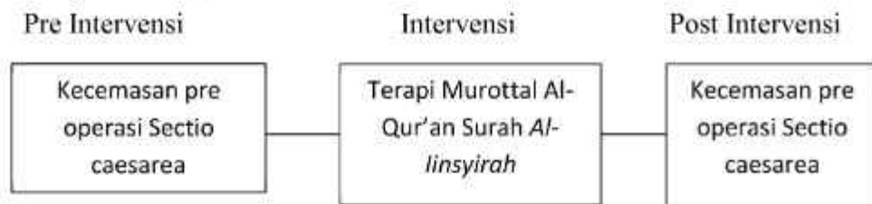
Gambar 2.3 Kerangka Konsep