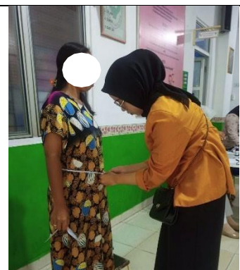
Gambar 9. Pengukuran Lingkar Pinggang Panggul (RLPP)