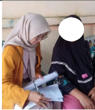
Gambar 2. Wawancara dan Pengisian Kuesioner