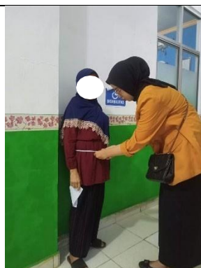
Gambar 8. Pengukuran Lingkar Pinggang Panggul (RLPP)