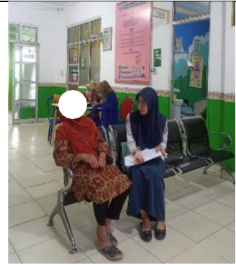
Gambar 3. Wawancara dan Pengisian Kuesioner