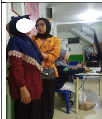
Gambar 7. Pengukuran tinggi badan menggunakan stadiometer