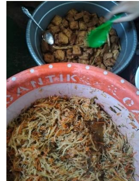
Menu makan Sore