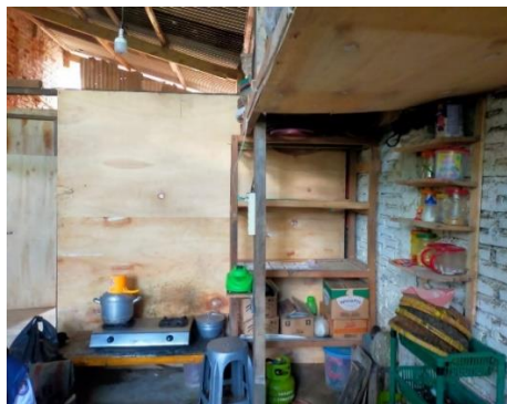
Tempat penyimpanan bumbu dan bahan kering