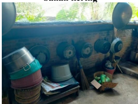
Tempat penyimpanan alat