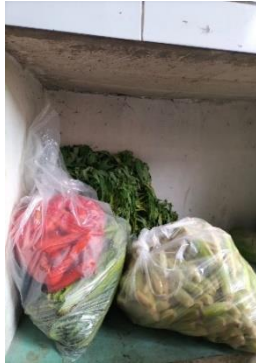
Penyimpanan bahan segar