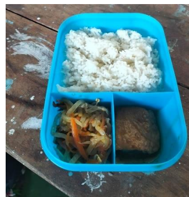
Porsi Makan Sore