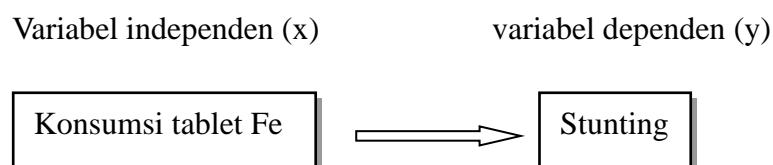
Gambar 2.2 Kerangka Konsep

Kerangka konsep penelitian adalah suatu uraian dan visualisasi hubungan atau kaitan antara konsep satu terhadap konsep yang lainnya, atau antara variabel yang satu dengan variabel yang lain dari masalah yang ingin diteliti (Notoatmodjo, 2018). Dari uraian kerangka konsep penelitian sebagai berikut: