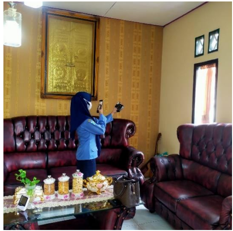
Pengukuran Pencahayaan Dengan Menggunakan Alat Ukur Lux Meter Di Rumah Penderita Tuberkulosis Kemiling Bandar Lampung