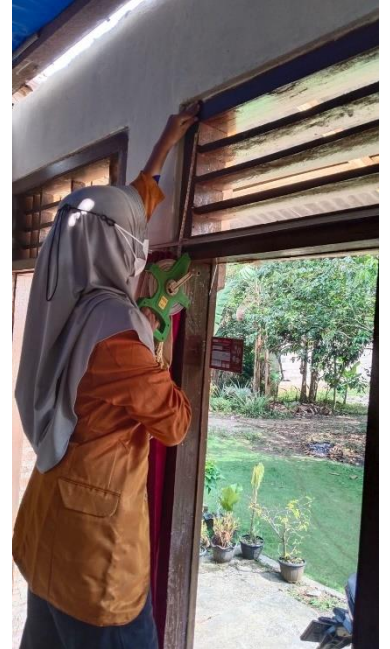
Pengukuran Ventilasi Dengan Menggunakan Alat Ukur Roll Meter Di Rumah Penderita Tuberkulosis Kemiling Bandar Lampung