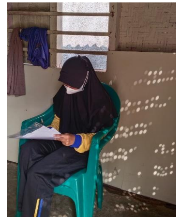
Pengecekan Instrument Checklist Di Rumah Penderita Tuberkulosis Kemiling Bandar Lampung