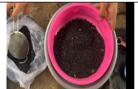
Proses pengayakan arang tongkol jagung dan serbuk gergaji