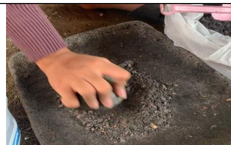
Proses pengecilan ukuran arang serbuk gergaji menggunakan lesung