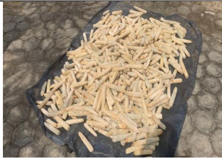
Proses penjemuran limbah tongkol jagung