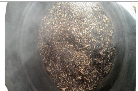
Proses pengarangan limbah serbuk gergaji