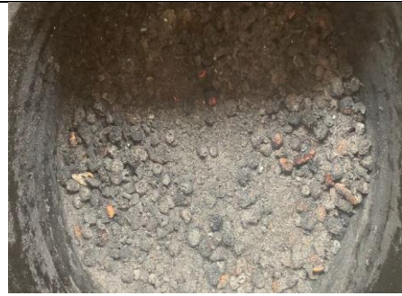
Proses pengarangan limbah tongkol jagung