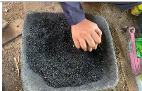
Proses pengecilan ukuran arang tongkol jagung menggunakan lesung