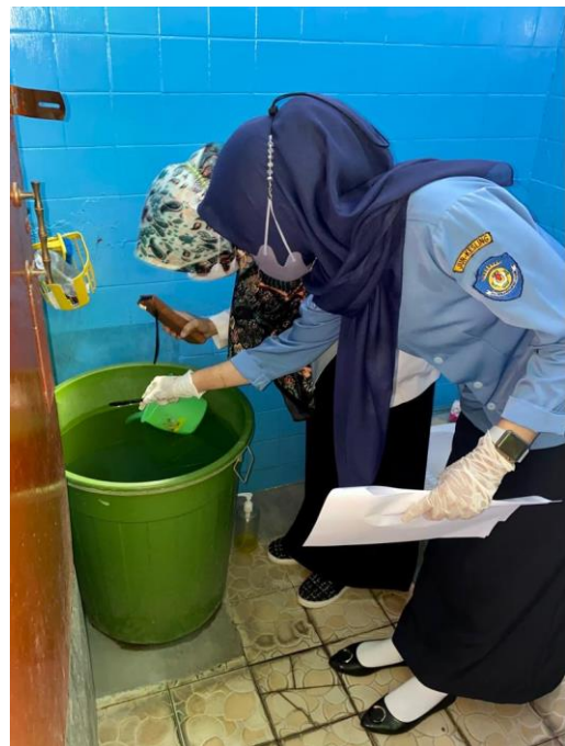
(Pemeriksaan bak kamar mandi)