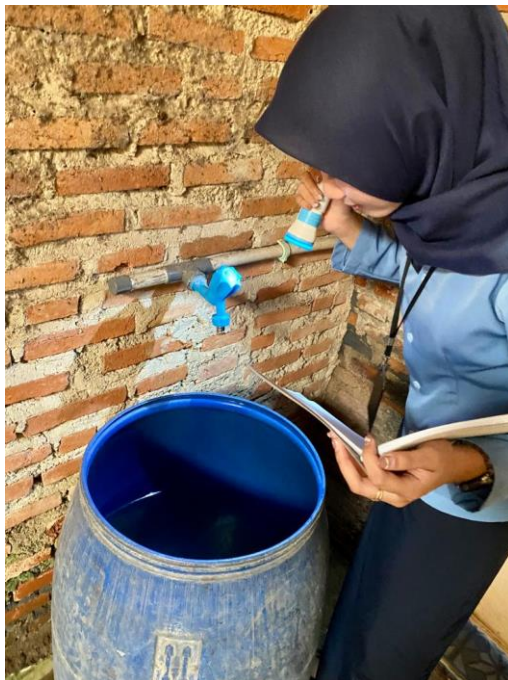
(Pemeriksaan bak penampungan air)