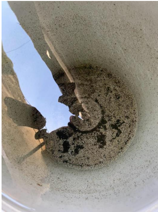
(Kondisi bak diluar rumah)