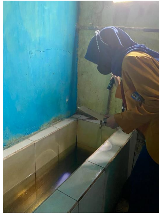
(Pemeriksaan jentik didalam bak mandi)