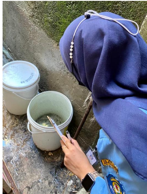
(Pemeriksaan bak penampungan diluar rumah)