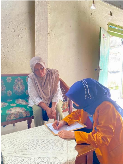
(Wawancara kepada pemilik rumah)