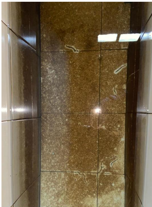
(Kondisi bak mandi tidak terpakai)