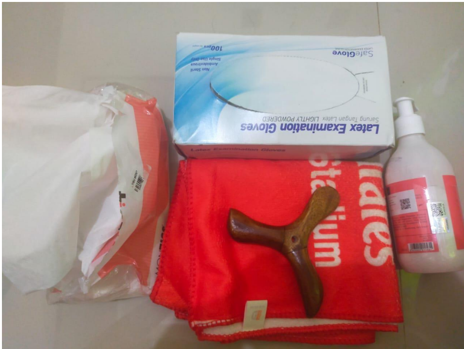
Lampiran 9 : Alat yang digunakan