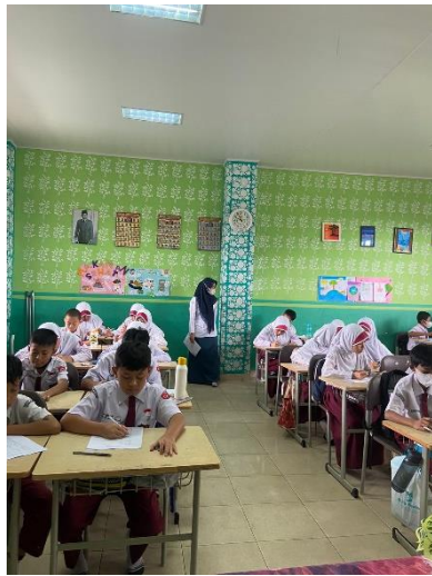
Siswa-siswi sedang mengerjakan kuesioner