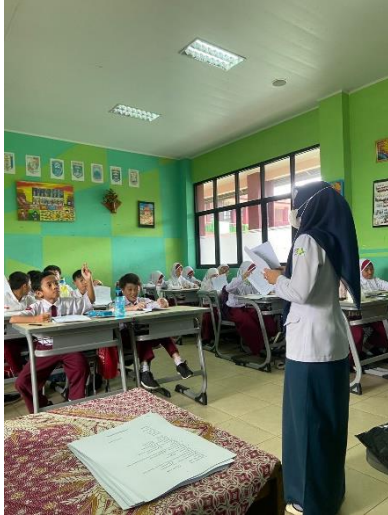
Menjelaskan cara pengisian Kuesioner