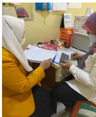
Pemeriksaan dan Pengambilan Data