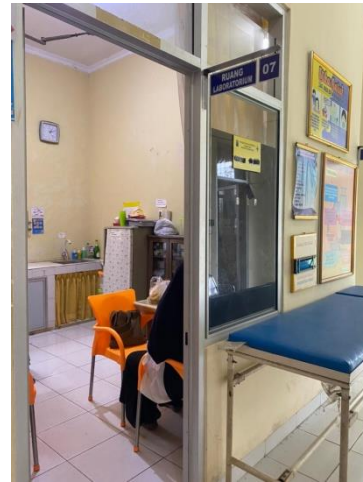
Laboratorium Puskes Hajimena