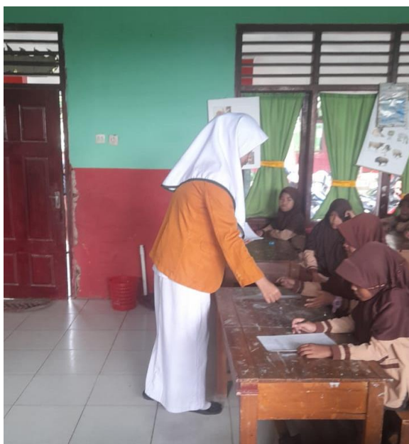
Dok. 2 Membagikan Kuisisioner Kepada Responden