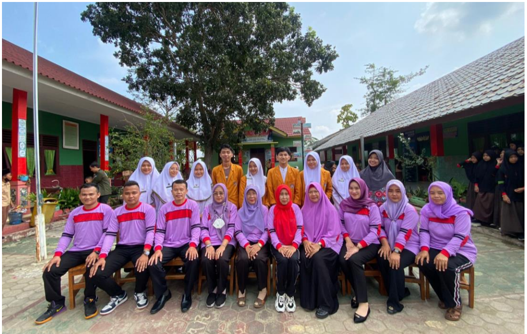
Dok. 5 Foto bersama