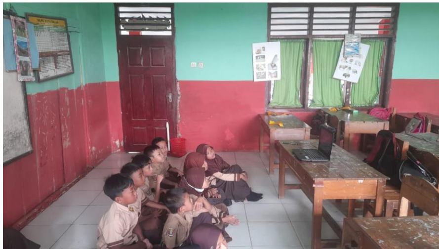
Dok. 4 Responden Menonton Animasi Kartun