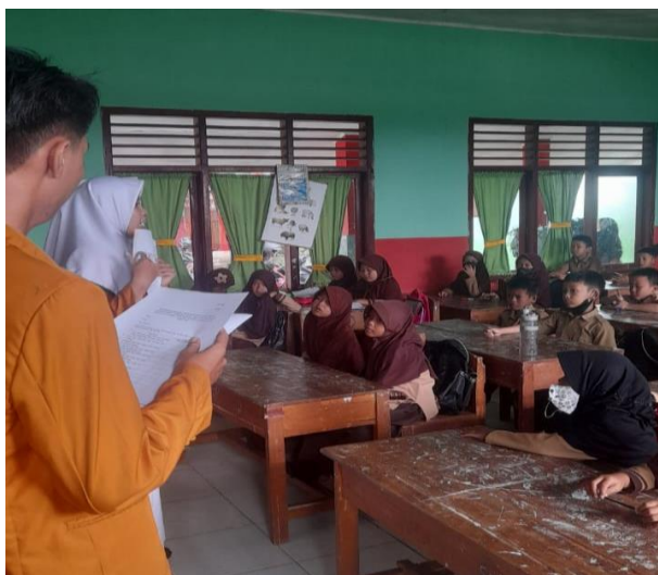
Dok. 1 Perkenalan dan Menjelaskan Mengenai Penelitian Kepada Respondeen