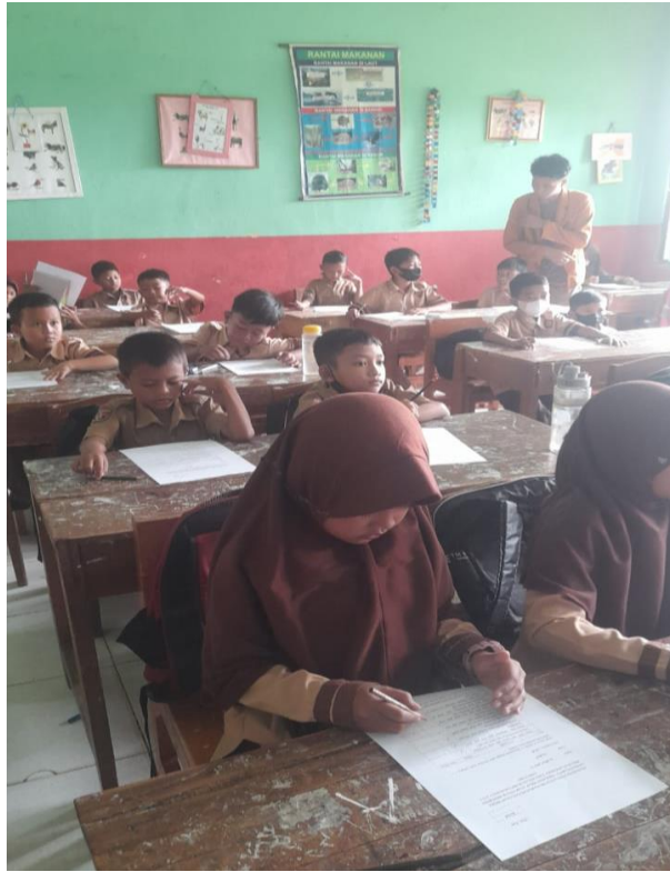
Dok. 3 Responden Mengisi Kuisisioner