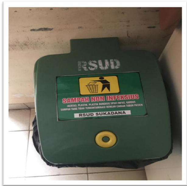
a. Kotak Sampah Limbah medis infeksius dan non infeksius