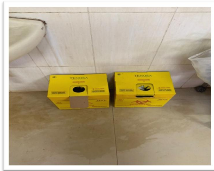
b. Safety box khusus limbah medis tajam