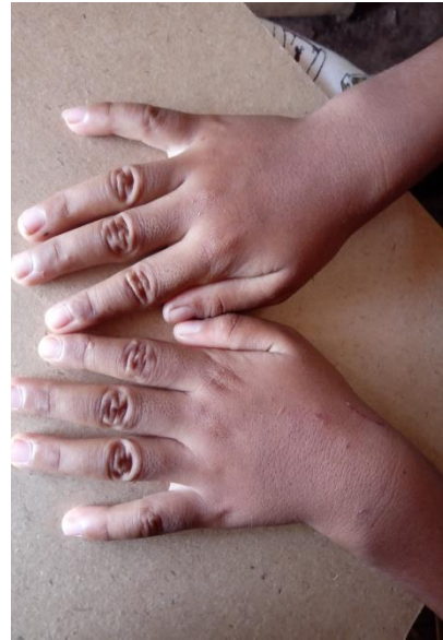
Pengamatan kuku pada penderita scabies