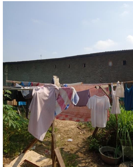
Pengamatan tingkat kebersihan baju, handuk, selimut, dan sprei