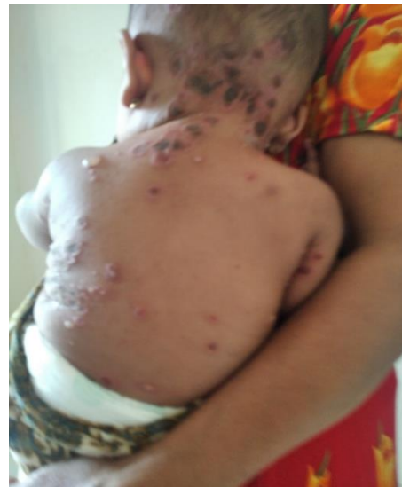
Pengamatan kondisi kulit pada penderita scabies