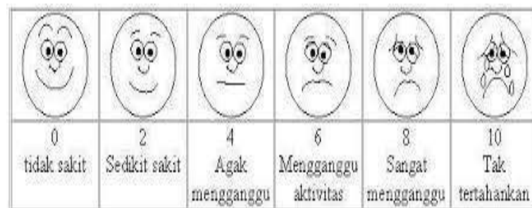
Gambar 2.2 : Skala wajah menurut wong-baker FACES rating scale Sumber: Haswita & Sulistyowati (2017)

Skala wajah menurut wong-baker FACES rating scale yaitu Pengukuran intensitas nyeri di wajah dilakukan dengan cara memperhatikan mimik wajah pasien pada nyeri tersebut menyerang, cara ini diterapkan pada pasien yang tidak dapat menyebutkan intensitas nyerinya dengan skala angka misalnya anak-anak dan lansia. Skala wajah menurut wong-baker FACES rating scal Sumber: (Haswita & Sulistyowati (2017)).