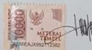
Bunga Widia Putri