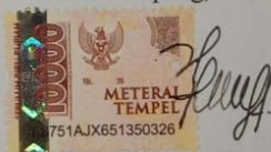
Niza Al Husna Salsabilla